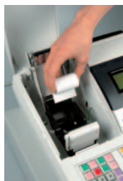
D & P (Drop and Print)