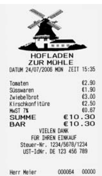
Bon-Muster (stark verkleinert)