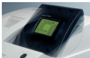
Das LCD-Display, schwenkbar