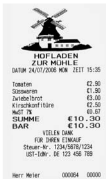
← grafisches Logo